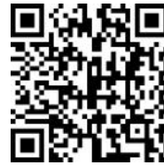
登记表 查询 二维码